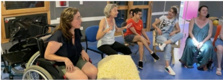
Durant la résidence, les artistes ont réalisé des ateliers avec les résidents, avant de restituer l'avancée de la création du spectacle, lors d'une représentation ce jeudi 20 juillet.

Trois artistes ont élu résidence afin de lancer un travail créatif avec les résidents.